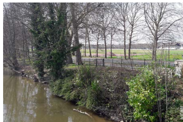
La Prairie à Caen : un espace de respiration en centre-ville, sur l'itinéraire de la Vélo-Francette

Sur cette séquence, les aménagements cyclables permettent de minimiser l'impact environnemental du tourisme en permettant à une partie des habitants de l'agglomération de se rendre sur le littoral et dans l'estuaire à vélo plutôt qu'en voiture. Les aménagements traversent rarement les sites fragiles, et s'ils le font, ils empruntent la plupart du temps un aménagement préexistant (chemin de halage, digue ou voie ferrée). En rendant plus accessible des sites naturels, ils peuvent aussi contribuer à la prise de conscience de leur intérêt environnemental et de leur préservation. Compte tenu de la multiplicité des usages, le risque principal peut être celui de la sur-fréquentation de certains sites plus fragiles, comme les méandres de l'estuaire de l'Orne.