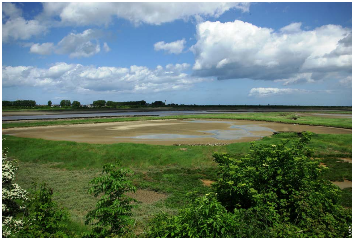
L'estuaire de l'Orne à Merville-Franceville, un site naturel à préserver.