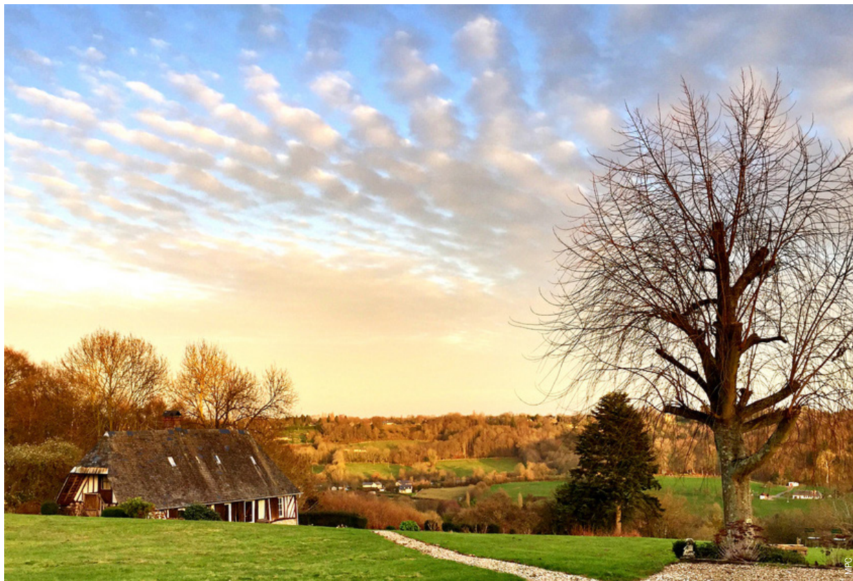
Paysage augeron, Ablon.