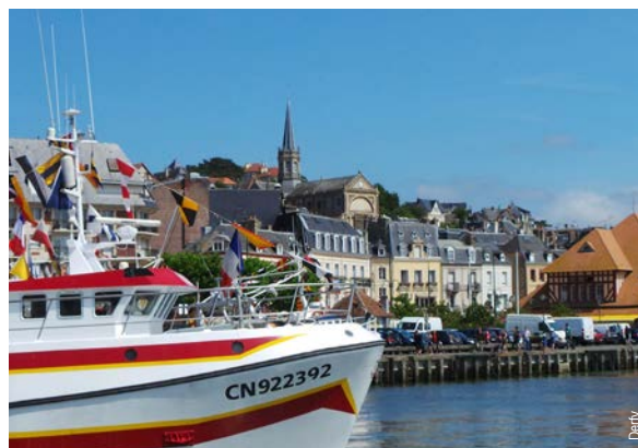
Le port de Trouville.

Le Département du Calvados n'a pas encore jalonné l'itinéraire de l'Eurovelo4 qui suit un parcours « de contournement de la côte » entre Deauville et Honfleur sur environ 40 km (dénivelés importants). Les aménagements en