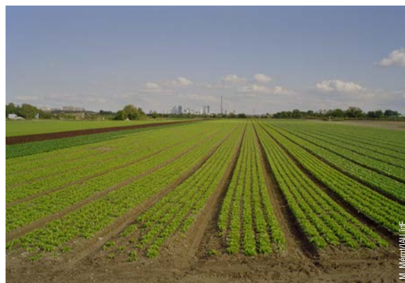
La plaine maraîchère de Montesson : culture de salades.

Certaines communes comme Le Vésinet ou Maisons-Laffitte disposent de trames viaires larges et apaisées où la promenade cycliste, dans des patrimoines paysagers exceptionnels, est aisée, mais plus largement, le réseau cyclable complémentaire à la véloroute qui permettrait de se connecter aux gares, et d'explorer les territoires en profondeur, est lacunaire. Son déve-