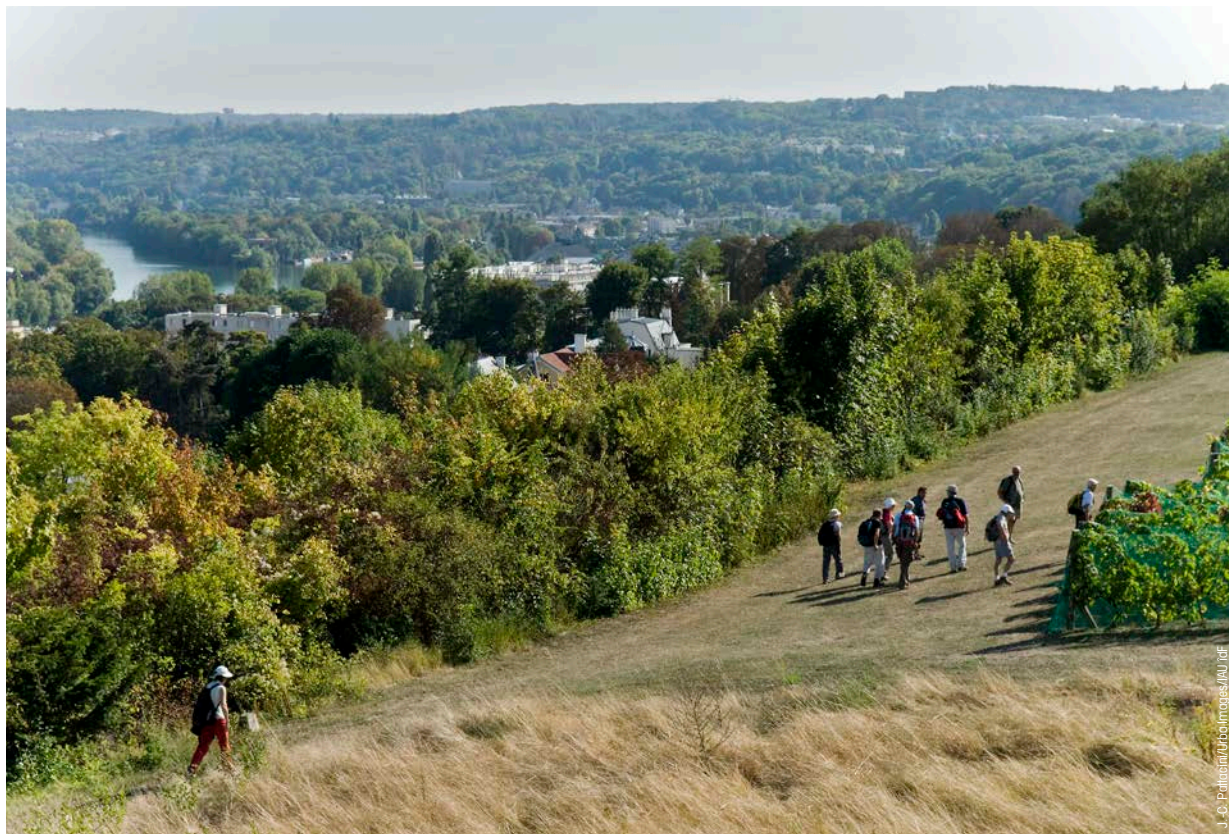
Vue depuis les terrasses du Château de St Germain en Laye sur la vallée de Seine.