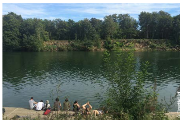
Des bords de Seine aménagés pour les cyclistes et les piétons à Croissy sur Seine (vue sur l'île des Impressionnistes).