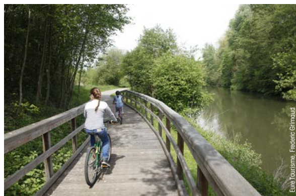
Voie verte de la Seine à l'Eure.