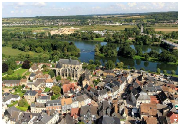
Vue aérienne, Pont-de- l'Arche.

Cette possibilité de mise en réseau fait de l'agglomération Seine-Eure un point d'articulation stratégique. La relation avec la Métropole Rouen Normandie, voisine, dans le cadre du pôle métropolitain Rouen-Seine-Eure