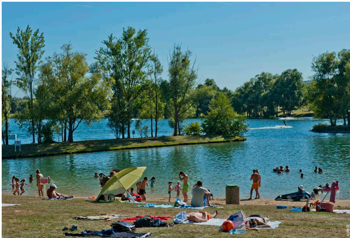
Base de loisirs Léry-Poses, Val de Reuil.