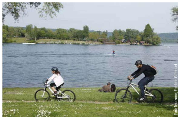
Voie verte de la Seine à l'Eure.

est également une réelle opportunité dans le domaine du tourisme dont la véloroute sera l'un des arguments permettant de maximiser les retombées économiques. La création et l'amélioration d'itinéraires cyclables et voies vertes seront également de nature à favoriser la qualité de vie des habitants et actifs du territoire, eux-mêmes ambassadeurs de son attractivité.