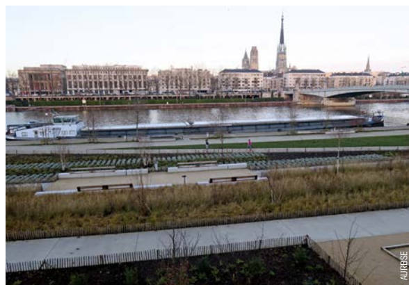
Quai bas rive gauche, Rouen.

Actuellement, l'itinéraire vélo identifié sur la séquence est positionné en rive droite, de Saint-Pierre-de-Manneville à Val-de-la-Haye (en voie verte), puis de Val-de-la-Haye à Croisset (en piste cyclable adossée aux cheminements piétons) sur la RD 51. Le prolongement de cet aménagement est programmé vers l'amont, mais ne se poursuit pas clairement entre le pont Flaubert et le centre-ville. Là, les aménagements des quais bas rive droite qui se poursuivent permettent la circulation des vélos mais la dimension de continuité est peu lisible