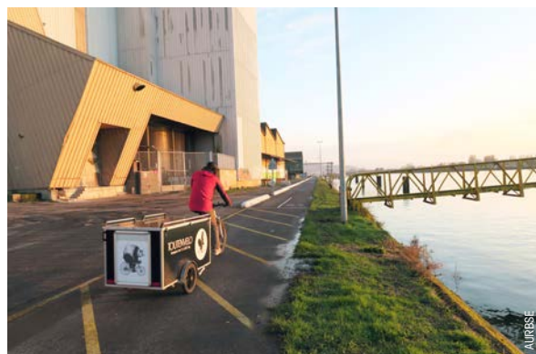
Nouvelle piste cyclable en amont de Rouen, rive droite.

L'itinéraire cyclable des bords de Seine est également en site propre sur la section entre Elbeuf et Caudebec-les-Elbeuf, rejoignant ensuite le territoire de l'Eure. Le Pôle métropolitain Rouen-Seine-Eure est en capacité de fixer la stratégie de déploiement de la véloroute sur son territoire réalisant ainsi la jonction des deux séquences Métropole Rouen Normandie et Seine-Eure.