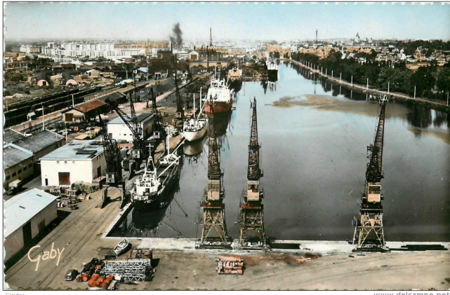
Le site lors sa période d'activité portuaire