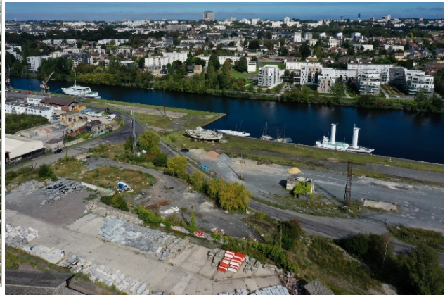
Le site aujourd'hui : une friche portuaire