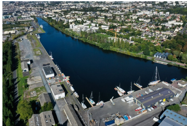
Les quais du Nouveau Bassin