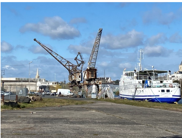
Navire à quai le Guerveur

Déjà une fois reportée à l'été 2021 au regard du contexte de la crise sanitaire, la saison d'animation de l'été 2022 n'a pas pu être organisée sur le site des quais du Nouveau Bassin pour raison de dureté foncière. Par ailleurs et malgré un travail d'échanges anticipés avec les acteurs locaux, l'appel à projets lancé fin 2022 par la SPLA pour la mise à disposition du site a dû être déclaré infructueux faute de projets répondants aux principales attentes du cahier des charges (vente d'alcool limitée aux softs et pas de musique amplifiée). Cependant un restaurateur de l'agglomération, sensibilisé par la démarche d'activation, a décidé d'acquérir le navire le Guerveur pour développer des activités culturelles et artistiques sur le quai. La SPLA est actuellement en relation avec lui pour prévoir des aménagements adaptés à son activité.