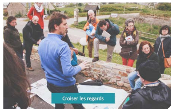
L'odyssée séquanienne, extraits de La Conférence, J. Billey, A. Fesquet, A. Jacquin, l'École nationale supérieure de paysage et l'agence d'urbanisme Le Havre - Estuaire de la Seine, 2021.